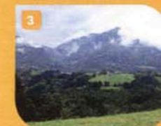
3 Teñidai Garagartzitik | Teñidai de Garagartza