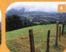
4 Garagartzitik behatokia | Mirador a San Martin de Garagartza