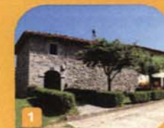
1 San Martin erria | Erria de San Martin