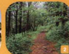
2 Bidea basan barrera | Barrera por el bosque